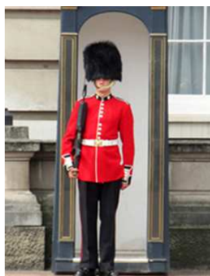
London Eye (l'œil de Londres) Garde de la reine devant Buckingham Palace