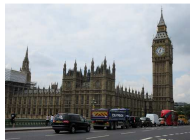
Palais de Westminster - (Chambres du Parlement)