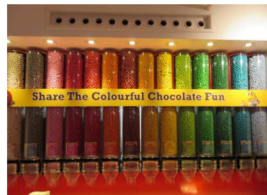
M&M's Word Store London