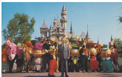
Walt Disney dans le parc de Disneyland

Il est un réalisateur très célèbre qui a produit des dessins animés entre 1901 et 1966. Il a créé le film « Mickey », qui est le premier dessin animé parlant. D'autres de ses films ont été les premiers films en couleur, avec de la musique et du son.